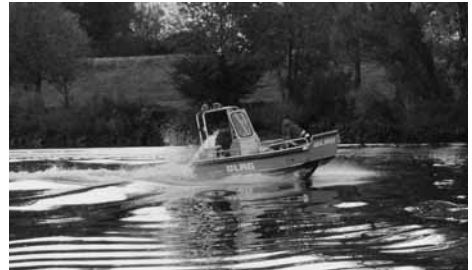
... und los geht's

Der nächste Tag begann mit leichten Kopfschmerzen, einem Weißwurstfrühstück