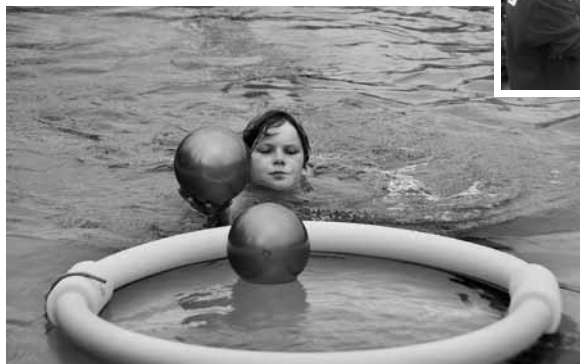
Sportlicher Ehrgeiz ist immer gefragt!

Versehen mit den erschwommenen und ersprungenen Punkten wurde zum zweiten Teilnehmer gewechselt. Dieser hatte einen Fahrrad- und Fendt-Kettcar-Traktor-Parcours zu absolvieren. Geschwindigkeit, aber vielmehr die Geschicklichkeit spielten dabei eine Rolle. Zum Abschluss war der Dritte im Bunde dran und durfte sich an einem Leichtathletik-Parcours des KLC versuchen, der es in sich hatte.