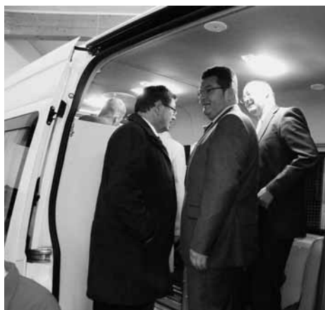
Begutachtung des neuen Einsatzwagens durch die Staatssekretäre Gerhard Eck und Franz Josef Pschierer und durch Landtagsabgeordnetem Bernhard Pohl

Die DLRG sei sehr froh darüber, dass das neue Fahrzeug die Kontinuität der Tätigkeit im Bereich Einsatz sicherstelle, führte Seibt aus. Dankend erwähnte er die Verankerung der Wasserrettung im bayerischen Rettungsdienstgesetz, was letztlich die Grundlage für eine staatliche Finanzierung der Investitionen bilde und die Qualität der ehrenamtlichen Arbeit wesentlich unterstütze. Er blickte zurück auf die Anfänge, als im Jahr