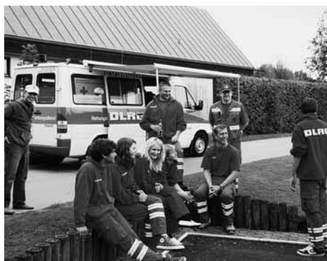
Vorbesprechung und Personaleinteilung – Alle antreten!

es die 50 Meter im Wasserballstil und mit zwei Ballwechslern zurück, um sich anschließend entscheiden zu müssen: wage ich drei unterschiedliche Sprünge vom Einer, zwei Sprünge vom Dreier oder gar einen Sprung vom 5-m-Turm.