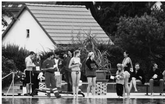
Wer startet als nächster?

Anmeldung fanden sich spontan Teams zusammen. Mit großem Hallo trafen sich altbekannte Teams wieder und freuten sich auf einen wunderschönen gemeinsamen Tag. Anders als im letzten Jahr fand dieses Mal alles zentral im Jordanpark statt. Eine wichtige aber auch richtige Entscheidung,