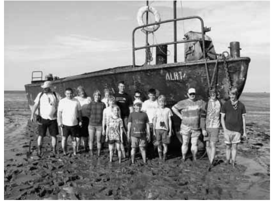
Nordfriesen-Abitur mit Klotstockspringen und Wattwanderung gehören zum Husumbesuch

und natürlich der obligatorischen Wattwanderung.