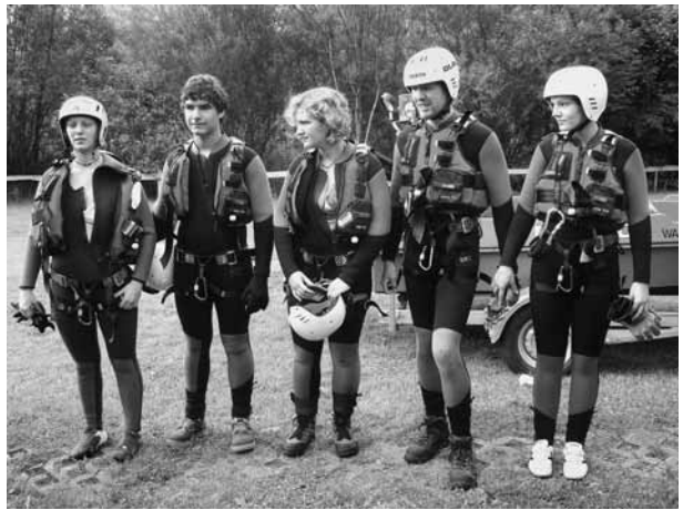
Alle fit für die Canyoning-Tour?