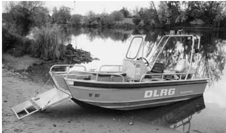
Bitt einsteigen ...

und natürlich Boot fahren. Während die einen die Donau auf und ab düsten, gingen andere in die Stadt, in das nahe liegende Einkaufszentrum oder wärmten sich einfach in der Einsatzzentrale der Regensburger auf, die uns dort freundlich aufgenommen hatten. So verging auch dieser Tag wie im Flug und der Abend rückte näher. Nach einem versal-