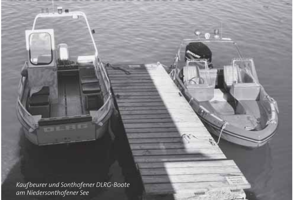
Kaufbeurer und Sonthofener DLRG-Boote am Niedersonthofener See

A m 4. und 5. Juni 2009 waren wir für die Fachausbildung Wasserrettungsdienst am Niedersonthofener See. So konnten wir am Samstag nach einer kurzen theoretischen Ausbildungseinheit die Fahrt an den NiSo beginnen.