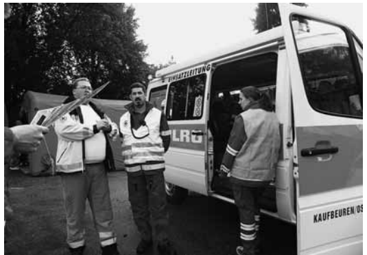
Übung in Buchloe mit über 120 Helfern auf dem Gelände der Fa. Karwendel

Neben unserer UG-SanEL nahmen auch einige unserer jüngeren aktiven Mitglieder, die derzeit die Fachausbildung Wasserrettungsdienst durchlaufen, als Beobachter an dieser Übung teil. Sie konnten sich dadurch ein Bild vom Ablauf einer Rettung, den Aufgaben verschiedener Rettungseinheiten und die Koordinationsarbeit der Führungskräfte machen. ✧