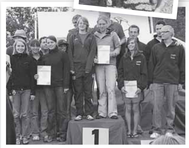
Siegerehrung Lifesaver, 2. Platz

Bayerische Vizemeister. In allen Disziplinen konnte zudem ein neuer Vereinsrekord aufgestellt werden.