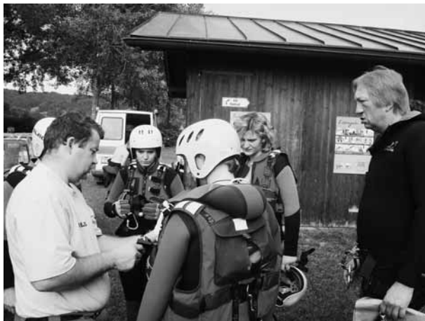
Fachgerechtes Montieren eines Rettungsgurtes