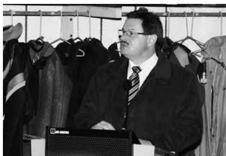
Der Staatssekretär im Bayerischen Staatsministerium des Innern, Gerhard Eck, hielt die Festrede