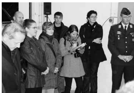
Ein kleinr Ausschnitt aus dem Kreis der geladenen Gäste