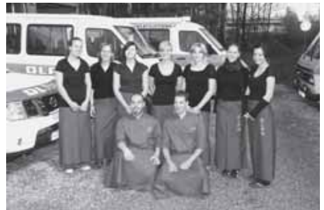
Unser bewährtes Catering-Team im DLRG-Outlet, welches wiederum ein hervorragendes Buffet serviert hat – besten Dank!