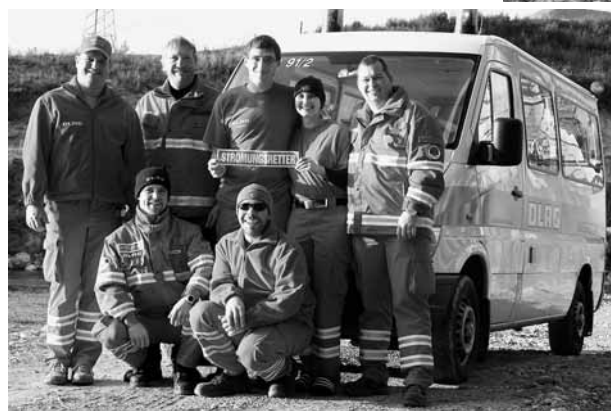
Oben: Strömungsretter bei Erkundung vor Ort Links: Endlich geschafft – die frischgebackenen Strömungsretter

schauten mal, was die Kollegen aus Sonthofen so in ihrem Strömungsretterhänger hatten.