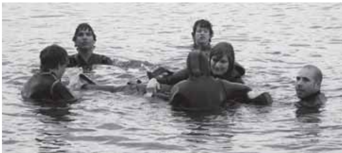
Üben einer Verletztenbergung im Wasser